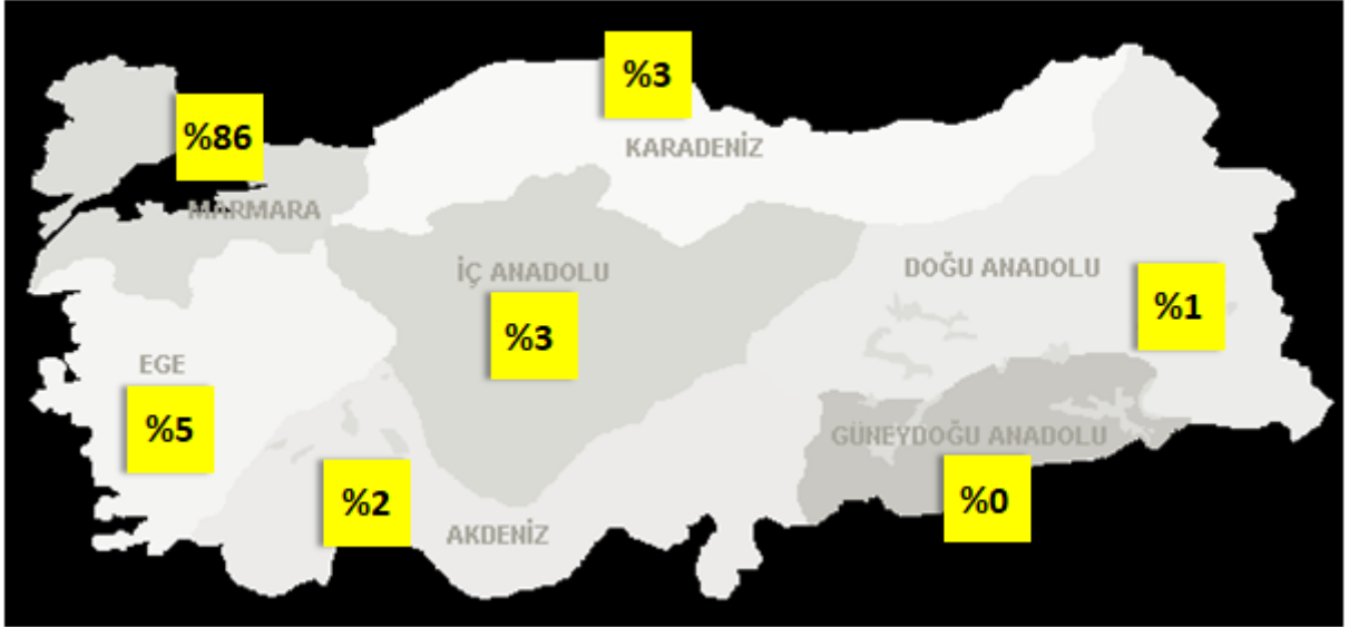
Ziyaretçilerin Bölgelere Göre Dağılımı

Proses Mühendisliği Çözümleri ile Fabrikalarda Modernizasyon Zirvesi ve Sergisi, Türkiye'nin farklı bölgelerinden sanayicileri bir araya getirdi. Türkiye'nin 29 ilinden 1.708 kişi zirveyi ziyaret etti. Ziyaretçilerin oransal dağılımında Marmara Bölgesi ilk sırada yer aldı. Marmara Bölgesi'ni, Ege ve İç Anadolu Bölgesi takip etti.